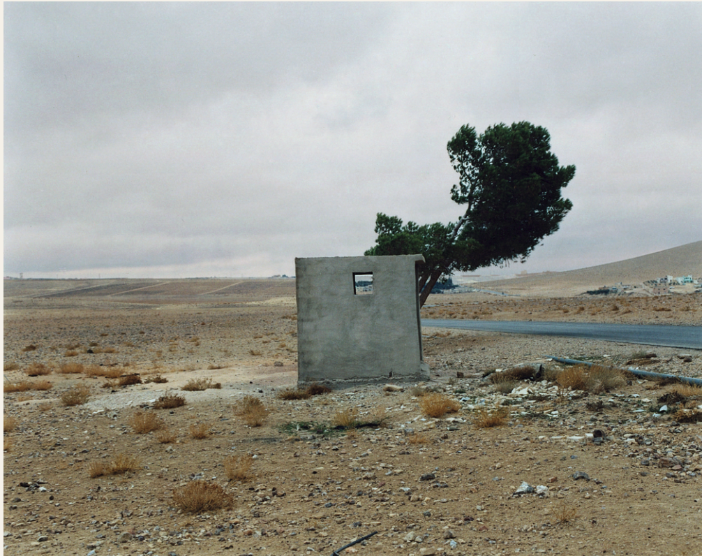
Paysage 2002-2008 Impression numérique