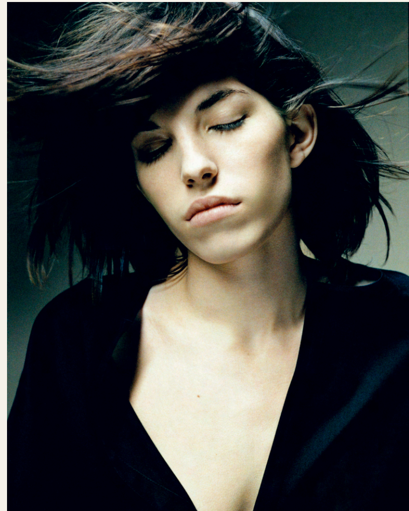
Lou Doillon Vers 2006