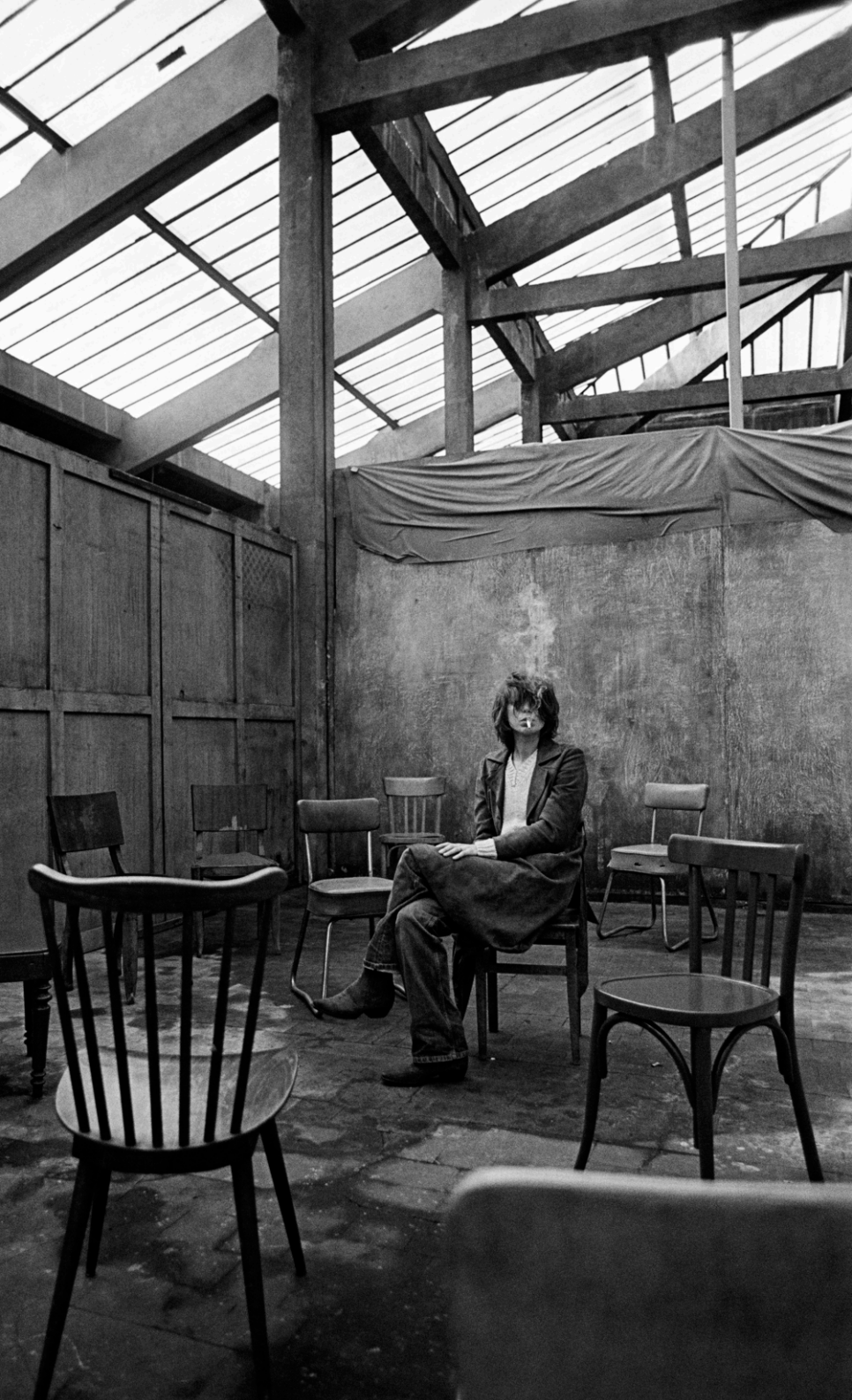
Autoportrait [pour Elle] 2001 Impression numérique © Kate Barry

8 avril 1967 Naissance à Londres, en Angleterre.