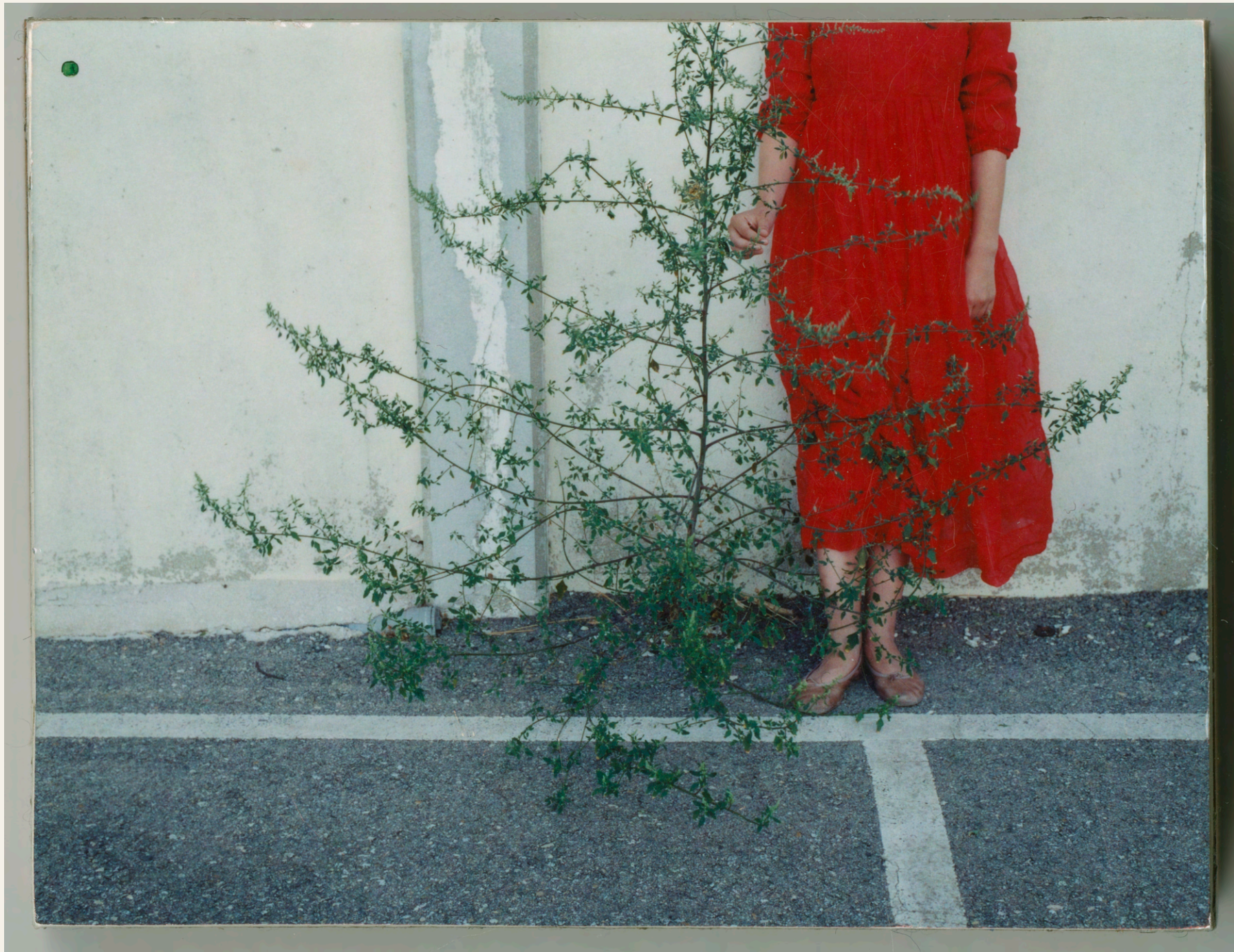
Mauvaises Herbes 2002-2008 Tirage C-Print