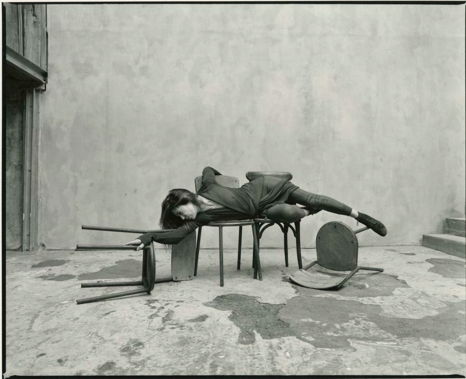
Jane Birkin, pour l'album Rendez-vous, 2004