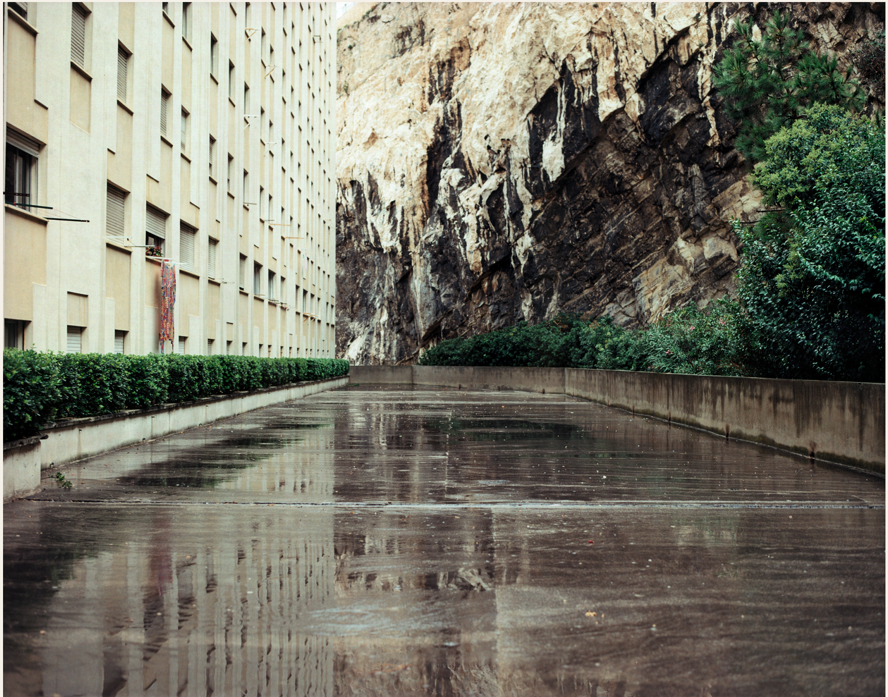
Paysage 2002-2008 Tirage C-Print